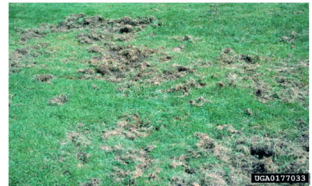
4. Schaden an einer Wiese durch die Larven des Japankäfers

Zierpflanzen: Calluna vulgaris (Heide), Dahlia sp., Aster sp., Zinnia sp. u.a. sowie die Ziergehölze Thuja sp., Syringa sp. (Flieder), Virburnum sp. (Schneeball) u.a.