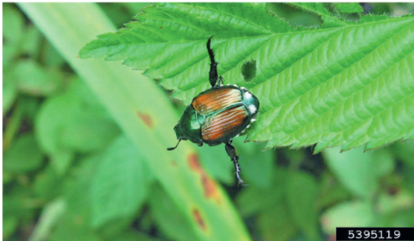
2. Typisches Verhalten des Japankäfers bei Gefahr

Die Engerlinge (Larven) unterscheiden sich von anderen Engerlingen durch v-förmig angeordnete Borsten am hintersten Körpersegment. Die Puppe gleicht der Form nach einem erwachsenen Käfer.