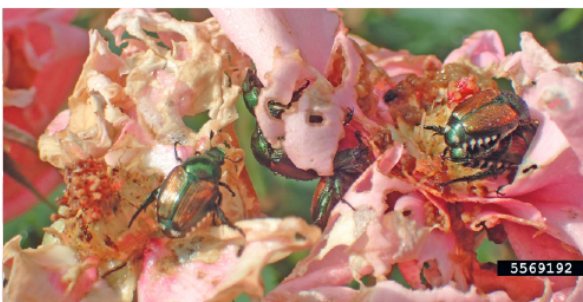
7. Fraßschäden an Rosenblüten

Wie kann das Einschleppen und Verbreiten verhindert werden?