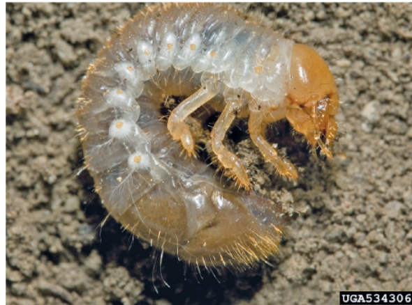
3. Popillia japonica - Larve